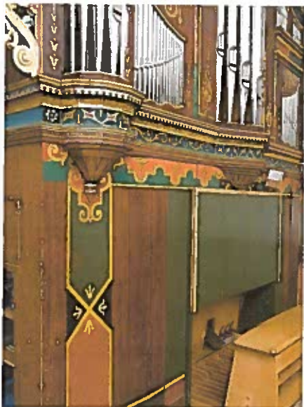
Panelvæg for restaurering.

Sekundære søm og skruer er fjernet. Løse profilled er så vidt muligt afmonteret og genlimet, men på grund af tidligere reparationer og limninger, har det ikke været muligt at genmontere nogle af de nederste profilled tæt til trækernen. Dækpladerne foran de små orgelpiber nederst er sikret med en skrue. Det er ikke muligt, at få dækpladerne placeret ind på deres oprindelige plads på grund af piberne bagved, og på grund af at pladerne har slået sig. Løse udskæringer er sikret, enten med lim eller skruer. De to yderste panelstykker har været afmonteret, da de var meget runde.