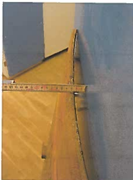
Venstre panelfelt for restaurering 2 cm. krumning.