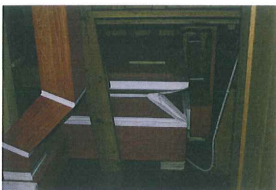
Orglets sokkelparti: ny foldebælg, rulleventil, kanal

Den bestående reguleringsbælg er fjernet og erstattet af en foldebælg med tilhørende rulleventil. Bælgen er anbragt i orglets underdel, og tilsluttet fælleskanalen via en kanal med rygslagsventil.