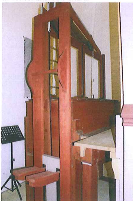
Kassebølge i Søllested kirke

Kassebælgeanlægget er tilsluttet med 2 nye kanaler med rygslagsventiler, og forbundet til vindladesektionerne.