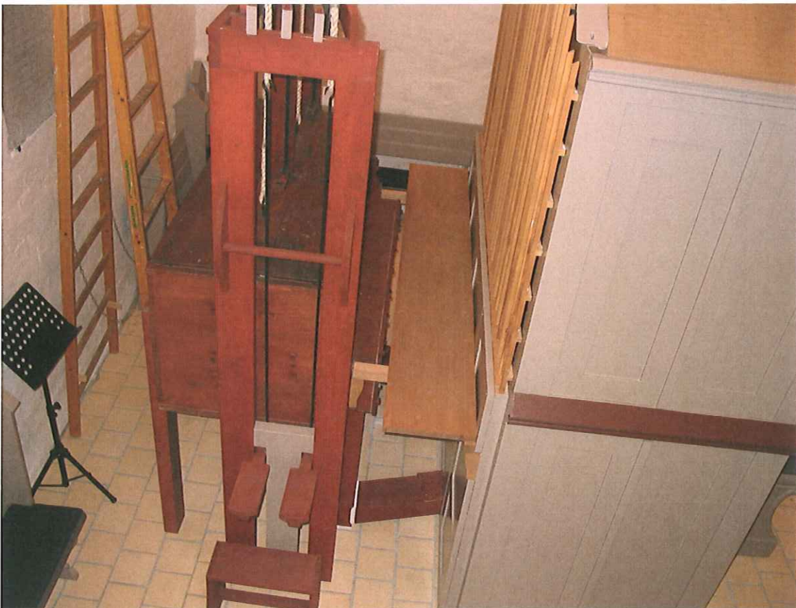
Den restaurerede kassebælg