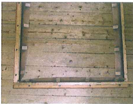
Pakninger til stempler, for udskiftning af skind.

Kassebælgeanlægget er tilsluttet med 2 nye kanaler med rygslagsventiler, og forbundet til vindladesektionerne.