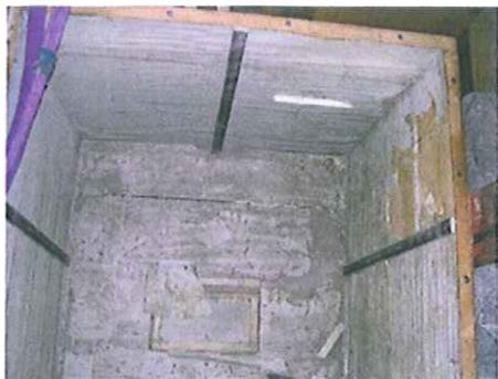
Cylinderkasser, før restaurering