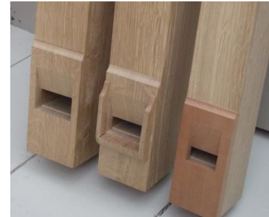
Træ-baspiber: Gedact, Quintadena og OctavFlöite