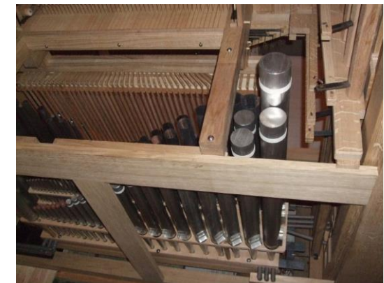
Under-Positivets indre værk set bagfra